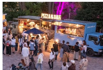
キッチンカーエリア

千葉 JPF ドーム前広場と第1駐車場に、フードからドリンクまで例年大好評のキッチンカーが出店します。50店舗のキッチンカーが並び、装飾で彩られた空間は、まるでファッション雑誌のページを切り抜いたような世界観を創出します。