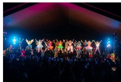
アートパフォーマンス

芝庭「おおやね」および「the RECORDS」のステージにて、個性豊かなダンサーやシンガーがパフォーマンスを繰り広げます。