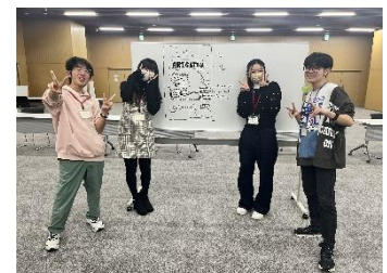
提案したグループ