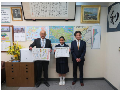
集合写真（写真左から更科中学校校長、「エリヤ君」さん、若葉区長）