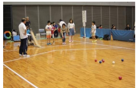
ボッチャ競技体験会