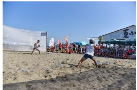
ビーチスポーツ（フレスコボール）