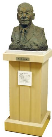
③川崎製鉄初代社長西山弥太郎胸像 (当館蔵)