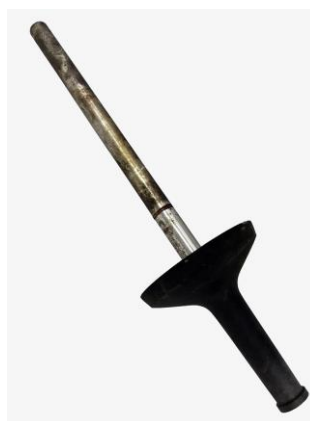
⑥東京オリンピック聖火リレートーチ (千葉市教育委員会蔵)