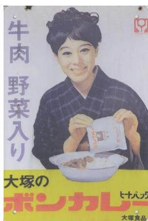
⑤ホーロー看板「ボンカレー」 (当館蔵)