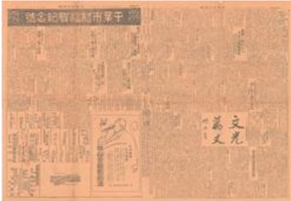
①千葉市制施行祝賀会の様子を伝える新聞 (大正10年5月24日付 千葉毎日新聞 当館蔵)

広報用提供画像（企画展） ※画像をご利用される場合は郷土博物館までご連絡ください。