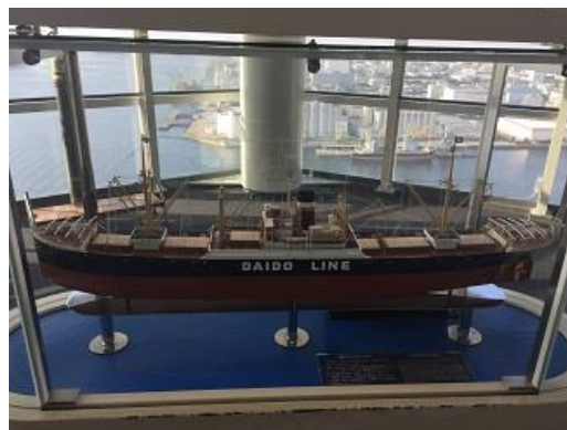
②模型「高栄丸」 (千葉ポートタワー蔵)