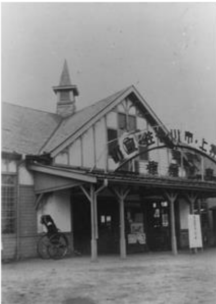
③京成千葉駅初代駅舎（大正10年7月開業）