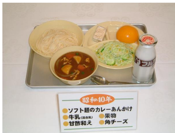
④模型「学校給食献立（昭和40年）」 (千葉県学校給食会蔵)