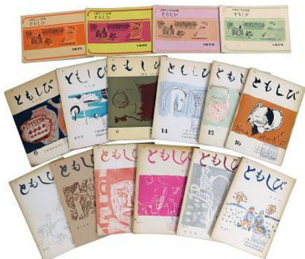
①千葉市子ども詩集・文集「ともしび」 (千葉市教育委員会蔵)

広報用提供画像（特別展） ※画像をご利用される場合は郷土博物館までご連絡ください。