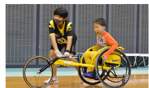
陸上競技(レーザー体験)