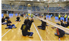
シッティングバレーボール