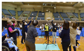
シーソー玉入れ、他2競技