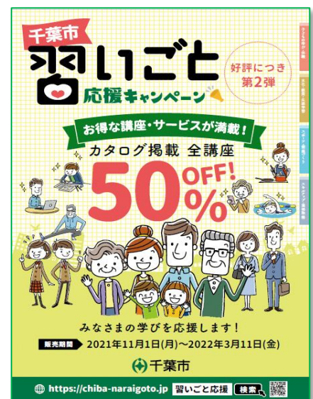
カタログ冊子表紙(イメージ)