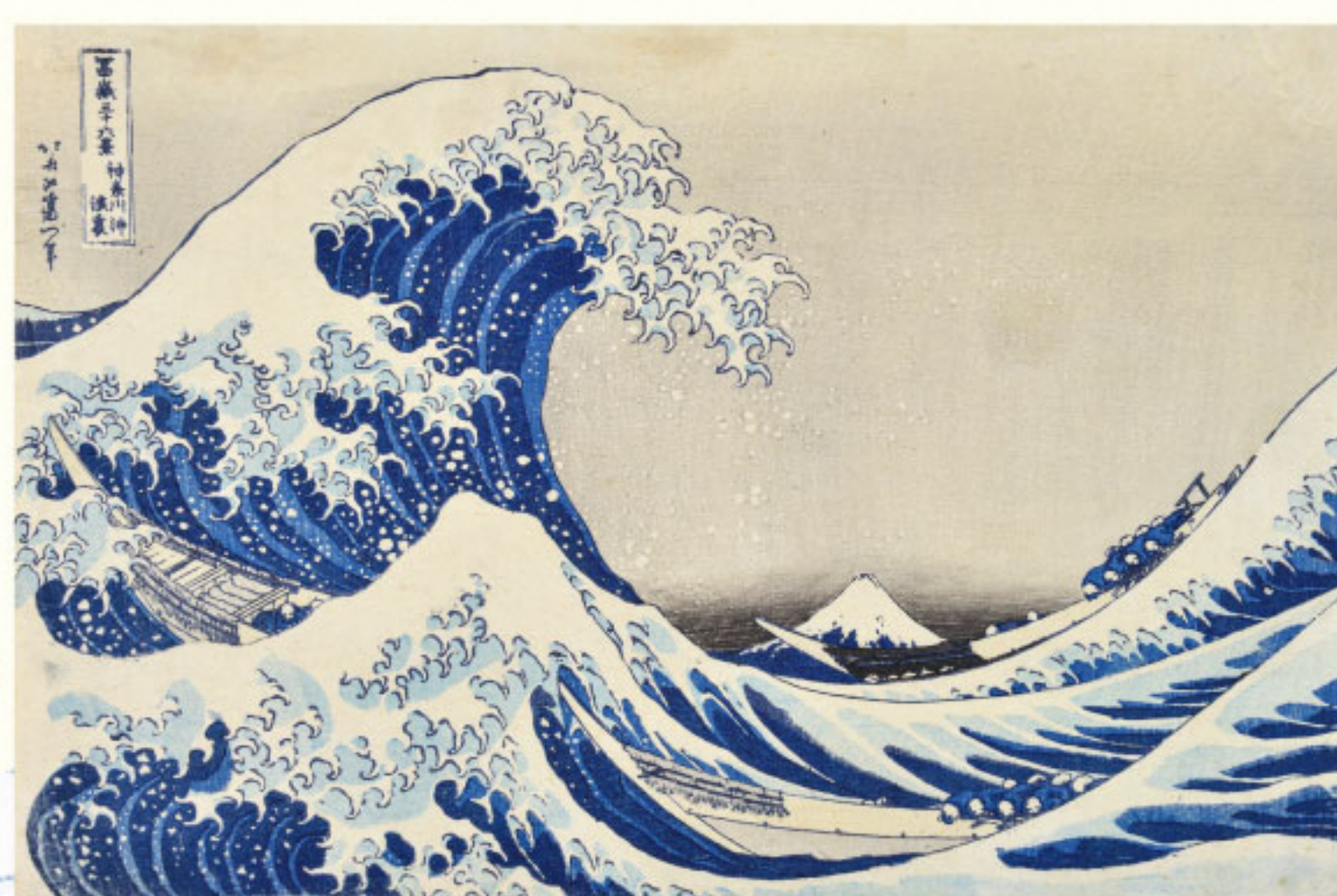
葛飾北斎《富嶽三十六景 神奈川沖浪裏》天保2-4年(1831-33)頃 大判錦絵 個人蔵 Katsushika Hokusai, "The Great Wave off the Coast of Kanagawa," from the series Thirty-Six Views of Mt. Fuji (Fugaku sanjūrokkei), c.1831-33, Private collection

葛飾北斎のこの作品は、世界で最も有名な浮世絵と言えるでしょう。そのインパクトは、西洋の芸術活動に大きな影響を与えました。