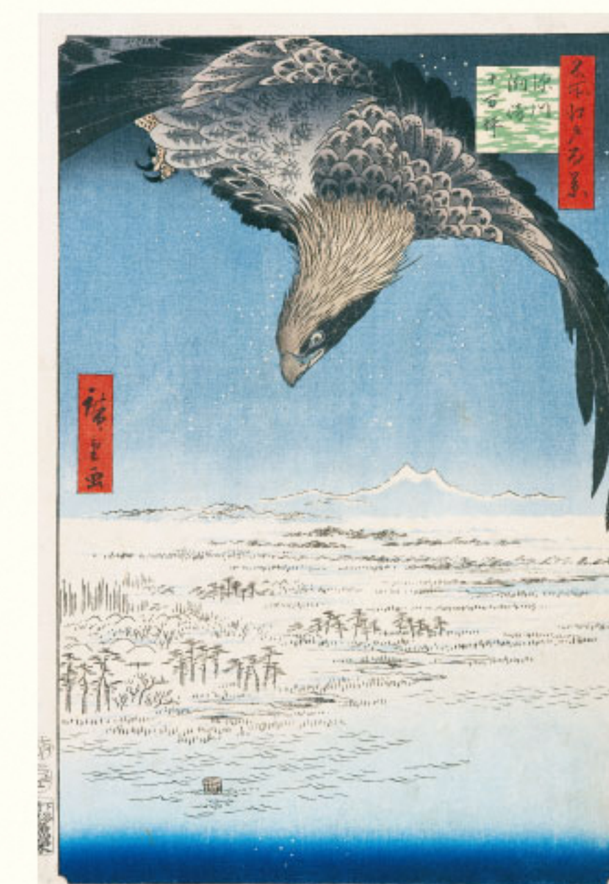
歌川国重《空江江面》 歌川国重 一万七千八百四十二年(一八〇七) 大判錦絵 個人蔵 Utagawa Hiroshige, "Eagle over the Hundred-Thousand Tsubo Plain beyond Susaki in Fukagawa," from the series One Hundred Views of Famous Places in Edo (Meisho Edo Hyakkei), 1857, Private collection