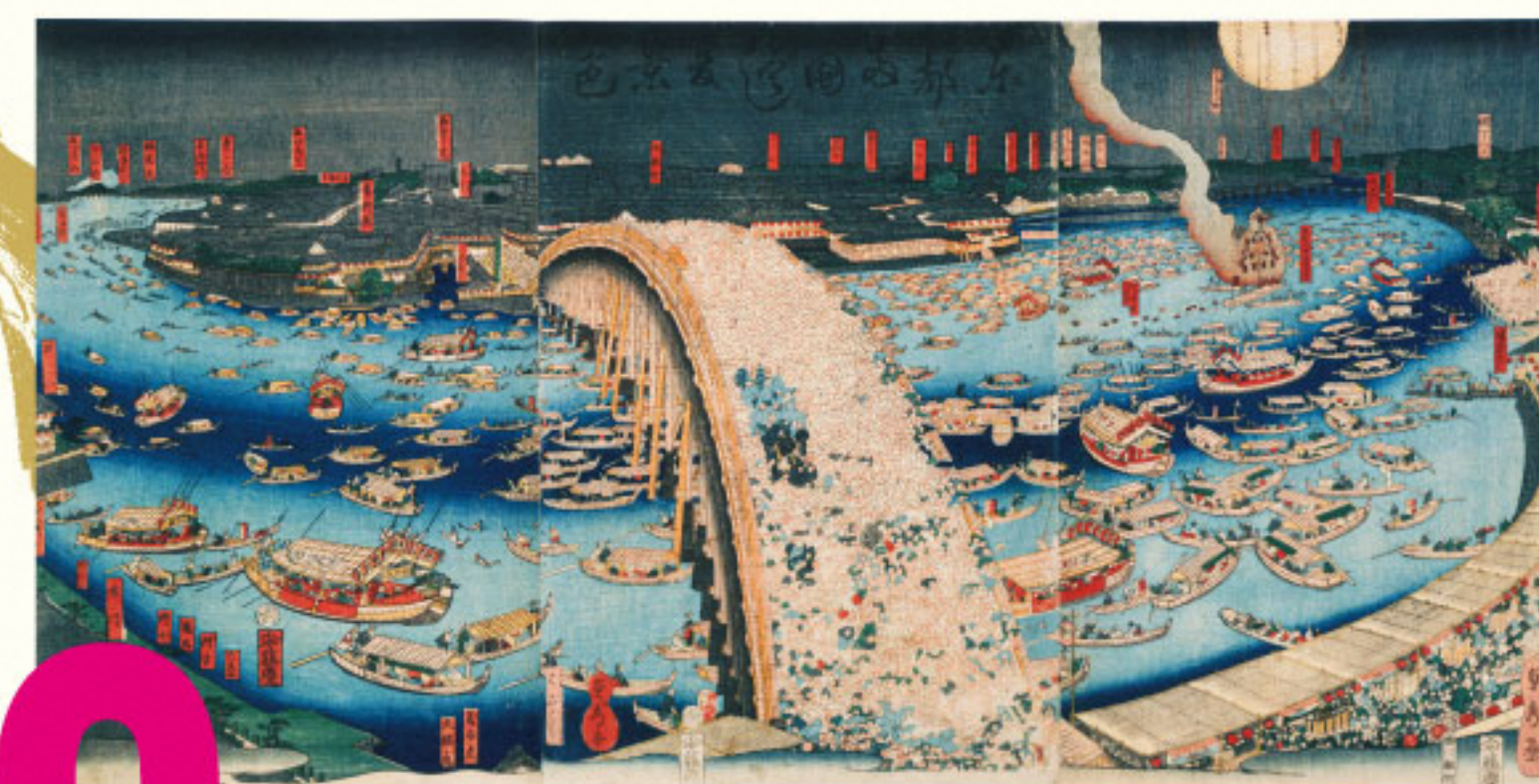
五雲季貞秀《東都両国ばし夏景色》 安政6年(1859) 大判錦絵3枚続 千葉市美術館蔵 Gounitei Sadahide, Summer View of Ryōgokubashi Bridge in Edo , 1858, Chiba City Museum of Art