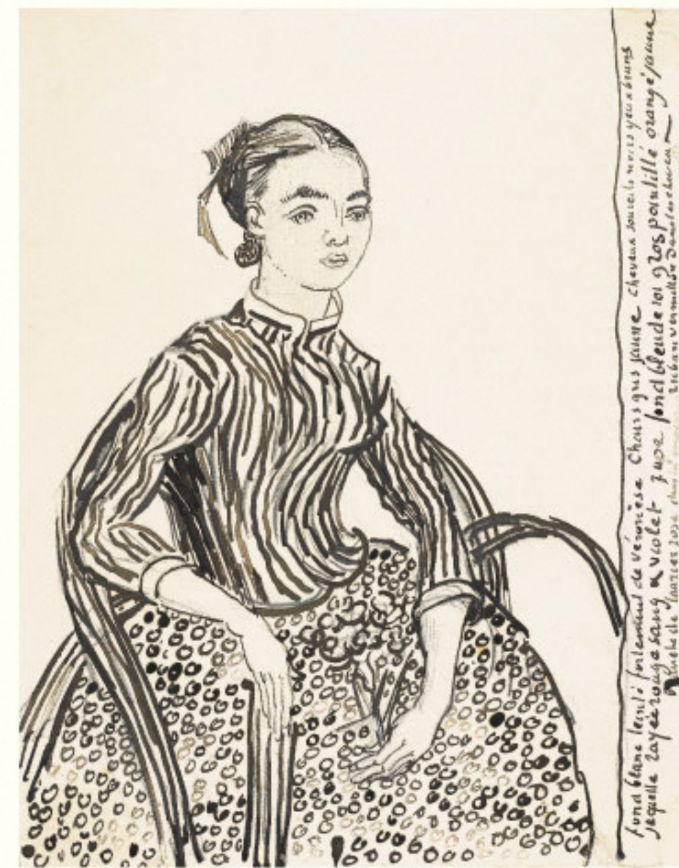
フィンセント・ファン・ゴッホ《少女の肖像「ラ・ムスメ」》 1868年 羽根ペンおよび筆ペン、鉛筆下書きにインク プーシキン美術館蔵 Vincent Van Gogh, Portrait of a Girl (La Mousmé) , 1868, The Pushkin State Museum of Fine Arts, 22

江戸時代を通して大衆にとって身近な存在であった浮世絵版画は、明治時代に西洋からもたらされた“美術”という価値観に値するものとも気づかれることのないまま、大量に欧米に渡り、ジャポニスムと呼ばれる動向を導きました。