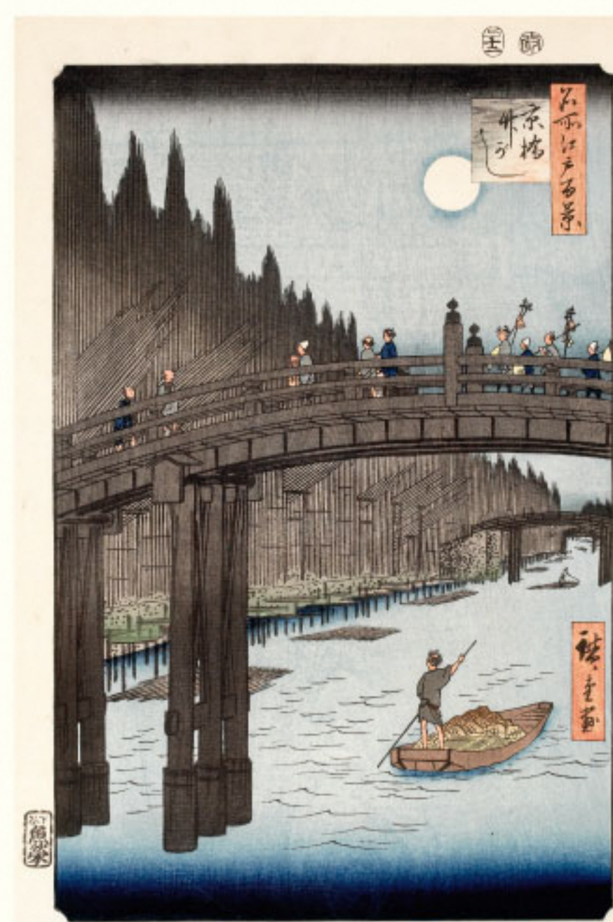
歌川広重《名所江戸百景 京橋竹がし》安政4年(1857) 大判錦絵 ホノルル美術館蔵 Utagawa Hiroshige, "Bamboo Yards, Kyōbashi Bridge," from the series One Hundred Views of Famous Places in Edo (Meisho Edo Hyakkei), 1857, Honolulu Museum of Art, Gift of James A. Michener, 1976 (16822)