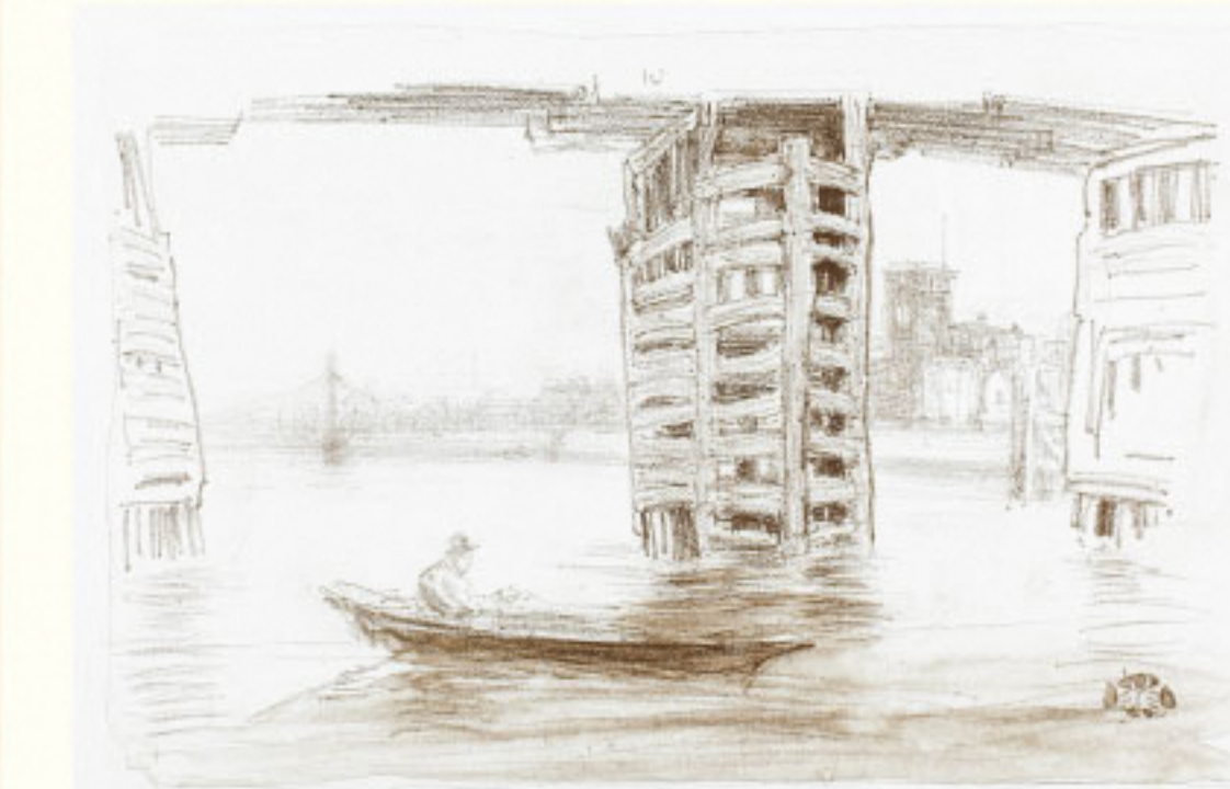
ジェームズ・アボット・マクニール・ホイッスラー《広い橋》 1878年 リトエント 町田市立国際版画美術館蔵 James Abbott McNeill Whistler, The Board Bridge , 1878, Litholint, Machida City Museum of Graphic Arts

水の都江戸では、隅田川を中心に江戸っ子の誇りの橋があり、その景観が愛されて浮世絵に多く描かれました。橋脚を大きくとらえる独特の構図が印象的です。