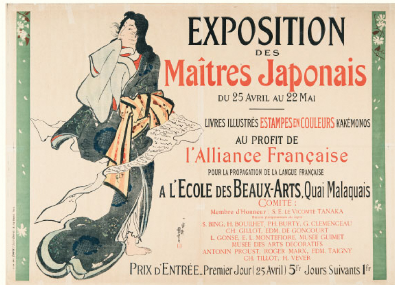
ジュール・シェレ《日本の巨匠展》のためのポスター 1890年 フォトリーフ多色刷 ジマーマ美術館蔵 Jules Chéret, Poster for the Exposition des Maîtres Japonais, Collection Zimmerli Art Museum at Rutgers University, Museum Purchase with funds from Minolta Corporation of America 1986.0465