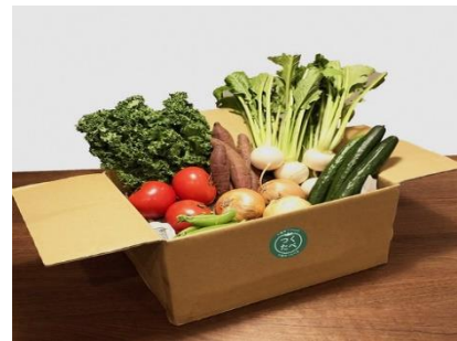
千葉市つくたべBOX (写真はイメージです)