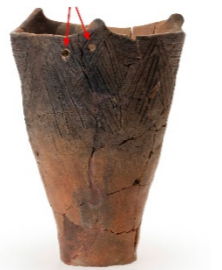
補修した痕が残る縄文土器(加曾利貝塚出土)