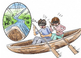
丸木舟を漕いで坂月川を下る