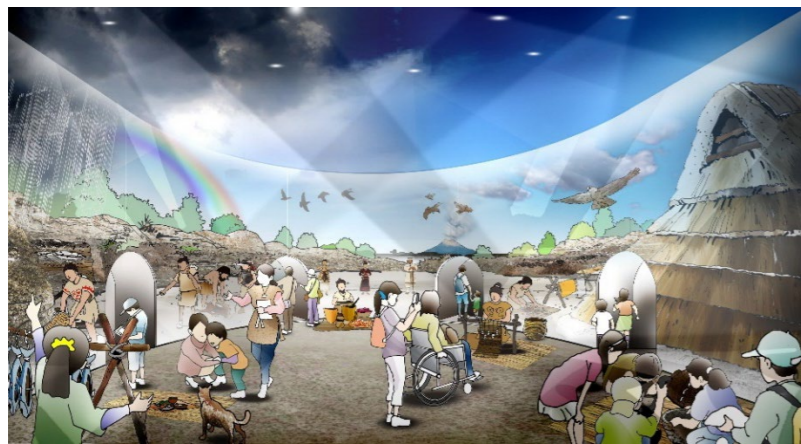
没入型展示「縄文体験空間」イメージ