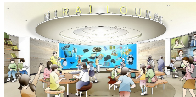
対話型展示「未来ラウンジ」空間イメージ