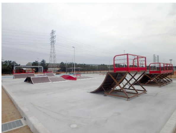
セクションの設置状況（クォーターランプ等）