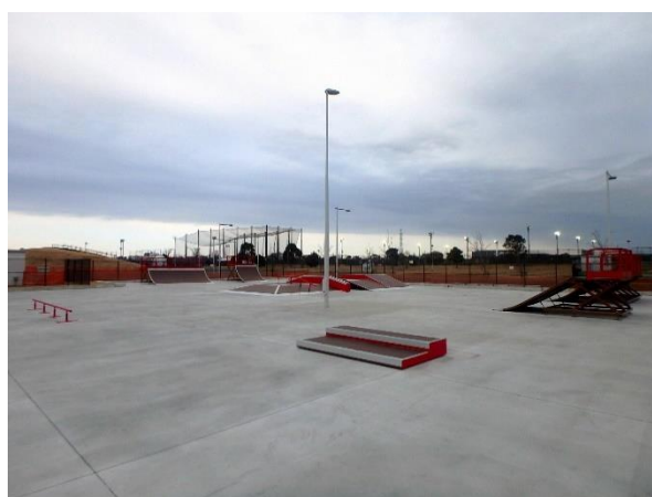
セクションエリア