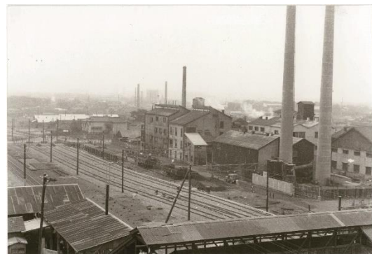
⑥参松工業 千葉工場 （昭和33年 当館蔵）