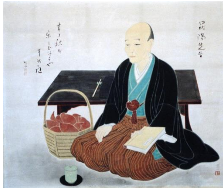
①青木昆陽肖像画 （千葉市幕張公民館蔵）

広報用提供画像（企画展） ※画像をご利用される場合は郷土博物館までご連絡ください。