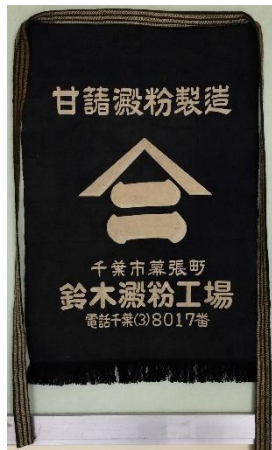
③デンブン工場従業員前掛け （千葉市立幕張小学校蔵）