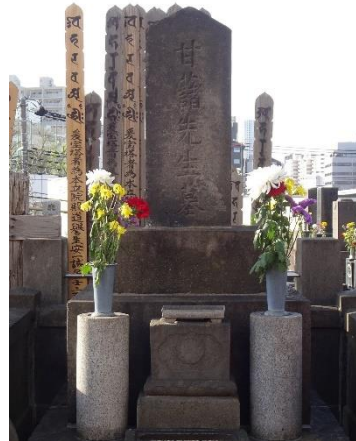
④青木昆陽墓 （東京都目黒区瀧泉寺墓地）