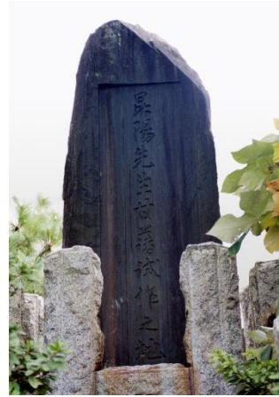
②青木昆陽甘藷試作地の碑 （花見川区幕張町）