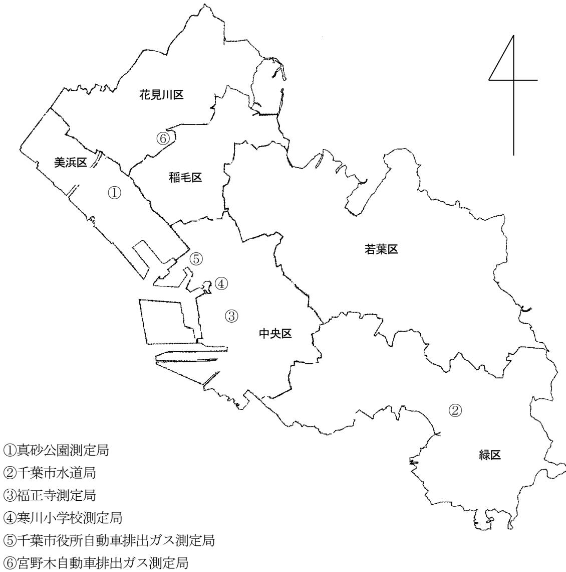
図1 有害大気汚染物質等モニタリング調査地点