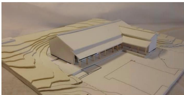
休憩施設のイメージ図