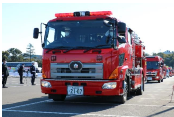
消防車両のパレード