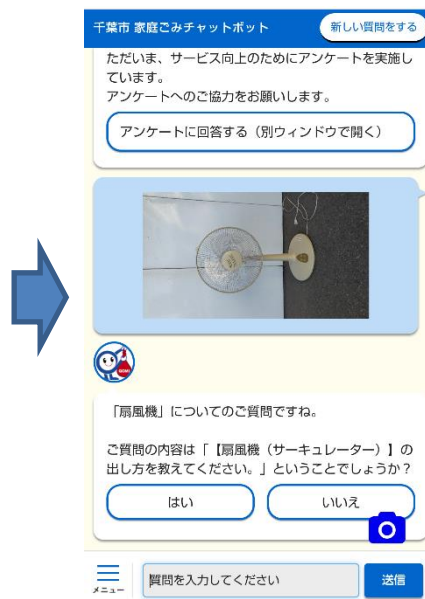
廃棄したい物品等を撮影し、AIが判別