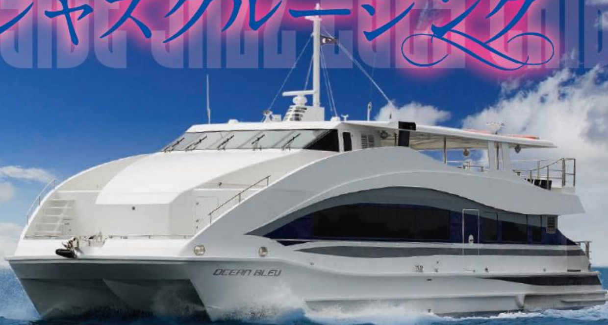
モナコスタイルクルーザー オセアンブルー号

「ジャズクルージングライブ」を開催。 ベイサイドジャズ千葉の連携イベントとして 海を眺めながらジャズライブを楽しみください。