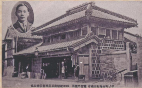
岩田屋（明治末～大正初期）

江戸時代に物流の拠点として繁栄した千葉町は、明治6年(1873)に千葉県が成立すると、県庁が置かれて県都となりました。大正時代に市制が施行され、昭和時代には空襲で被害を受けたものの、戦後復興・高度成長で再び繁栄を遂げるなど、激動の時代を歩んできました。今年が県都となって150年の節目の年に当たります。本展では、その激動するまちの歩みを商業活動に焦点をあてて見ていきます。千葉のまちの繁栄を支えた多くの商家がある中で、今回は特徴ある3家を中心として取り上げ、事業の様子や時代の激動の中における商人としての様々な選択について紹介します。