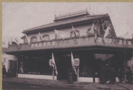
奈良屋千葉店（大正3年） （公財）奈良屋記念杉本家保存会蔵

寛保3年(1743)に京都で呉服商として創業。江戸時代後期には、「他国店持京商人」として佐原・佐倉に出店し、佐倉藩主や伊能忠敬などとも交流した。明治42年(1909)に出店した千葉店は、順調に売り上げを伸ばし、昭和5年(1930)には本店となっている。戦後に千葉随一の百貨店となった奈良屋は、昭和46年(1971)に三越と提携して、国鉄千葉駅前にニューナラヤを創立し、旧来の店舗をセントラルプラザとして模様替えした。千葉店を飛躍させた8代目杉本郁太郎は、杉本北柿という名で俳人としても活躍するなど、文化活動にも手広く参画した。京都には重要文化財「杉本家住宅」が現在も残る。