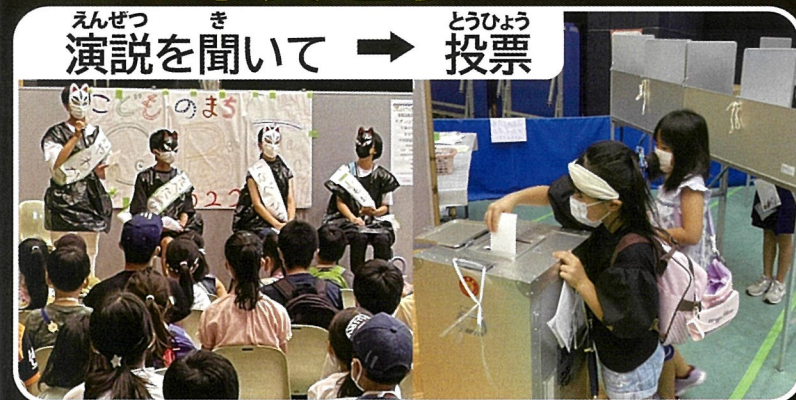
えんぜつ演説を聞いて → どうひょう投票