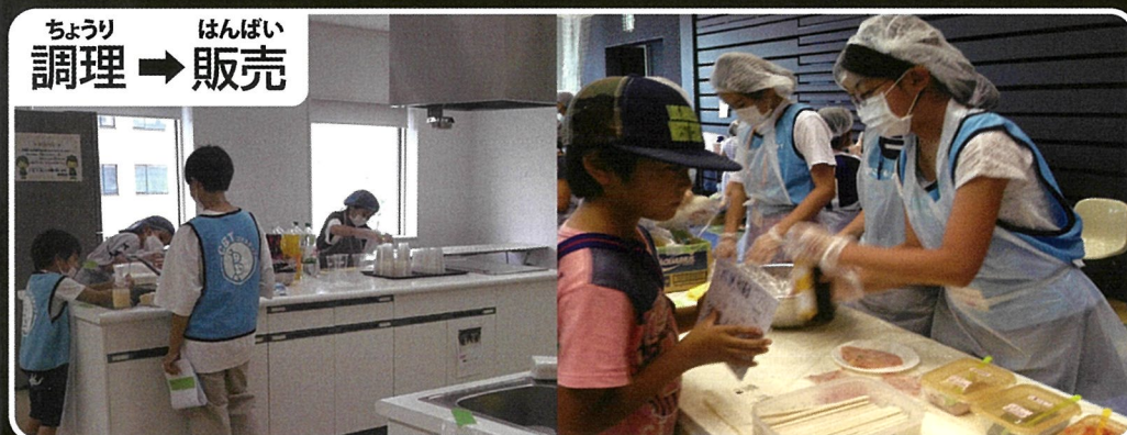
ちょうり調理 → はんばい販売