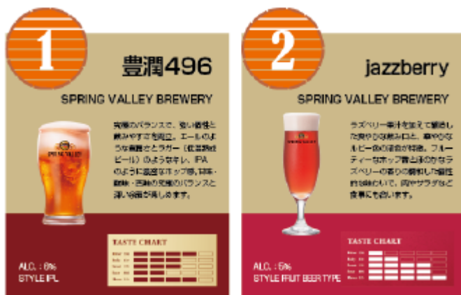
販売予定のクラフトビール銘柄(一部)