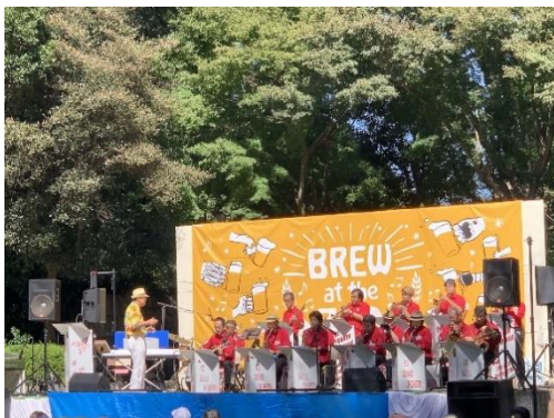
昨年の開催の様子

※将来、動物公園にバイオマスボイラーが導入された後は、燃料チップは動物科学館の動物用暖房に活用します。