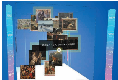
※大日本印刷(株)が開発した情報可視化ツール。立方体(キューブ)状のインタフェースを通して絵画の魅力を伝える仕組み。

さいしん ぎじゆつ かいが き づきを え 最新技術で絵画から気づきを得て 未来のくらしを想像してみよう!