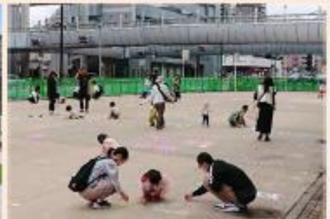
※地面へのお給かきは24日(金)のみ開催