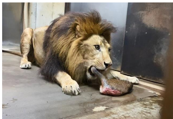
ライオンの屠体給餌の様子