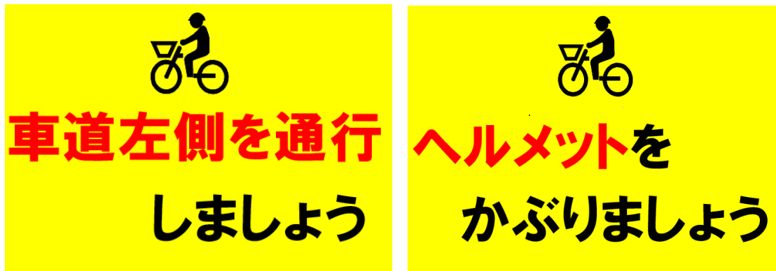
プラカードのレイアウト

実施対象区域内の歩道にて、自転車の安全利用を促す内容を示した以下のプラカードを持ち、通行する自転車利用者などに呼びかけを行います。