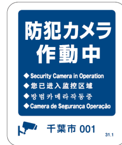
プレート・ステッカーのイメージ