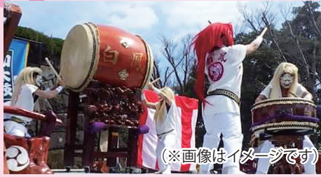
(※画像はイメージです)

郷土博物館前ステージにて、アーツステーションちばの協力による音楽、伝統芸能等のライブをはじめ大道芸人のパフォーマンスを開催いたします。