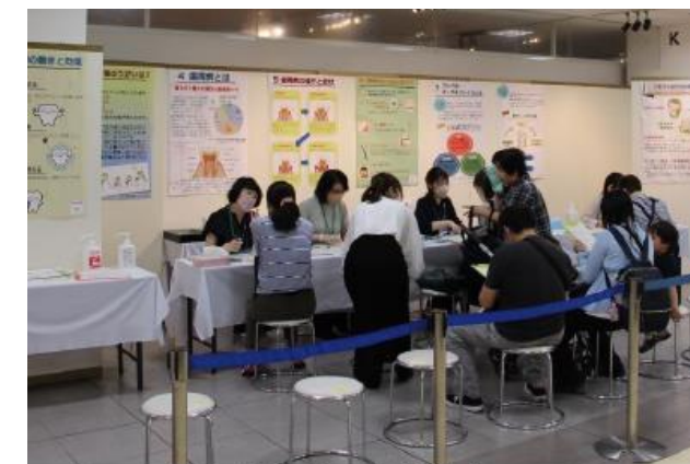
バタカ測定でお口の健康度チェック