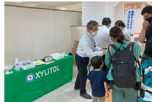
咀嚼チェックとお口のエクササイズ