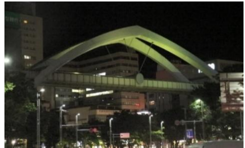
セントラルアーチ

※総合保健医療センター(美浜区幸町1-3-9) においても千葉市医師会がライトアップを実施する予定です。