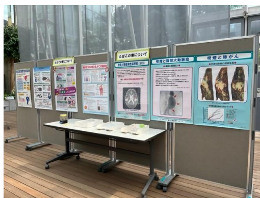
過去の禁煙パネル展の様子