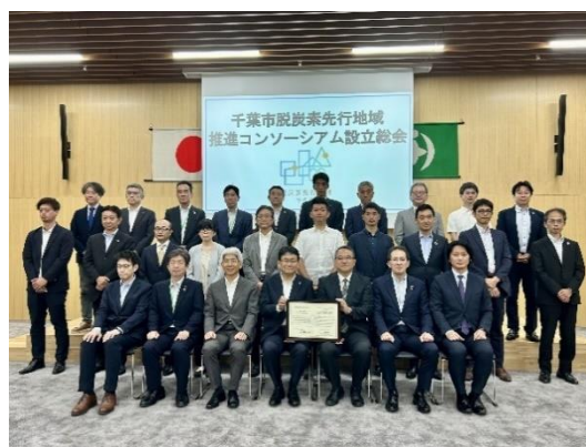
設立総会の様子(令和5年7月13日)