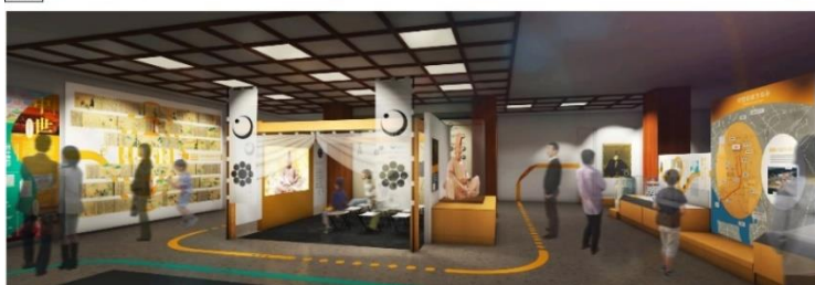
リニューアル後の2階（近世・近現代の千葉市）および3階（千葉氏展示）イメージ