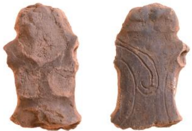
令和5年度調査で出土した土偶（左：正面、右：背面）