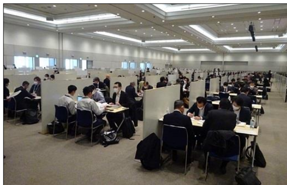
令和5年度に実施した「九都県市合同商談会2024」の商談風景 (会場: パシフィコ横浜 アネックスホール)

首都圏産業の国際競争力の強化を図るため、平成20年度から九都県市(埼玉県、千葉県、東京都、神奈川県、横浜市、川崎市、千葉市、さいたま市、相模原市)が連携して合同商談会を開催し、今回で17回目を迎えます。