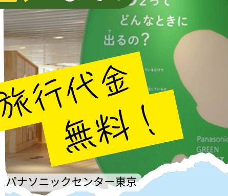
パナソニックセンター東京