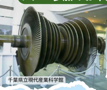
千葉県立現代産業科学館