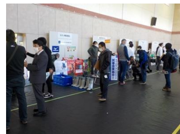
屋内ブース展示の様子