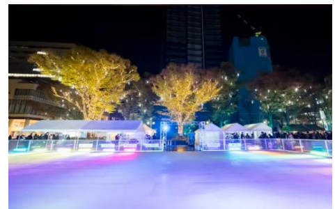
ルミラージュちば