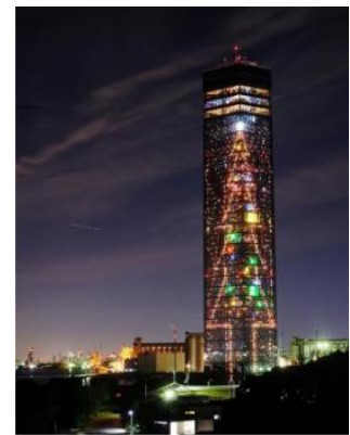
千葉ポートタワー クリスマスイルミネーション

【URL】 https://chiba-porttower.com/article.php?id=402