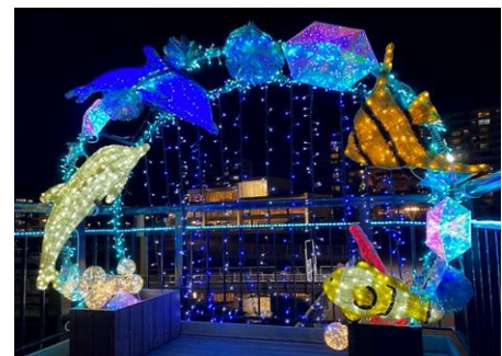
ちばみなとシーサイドイルミネーション