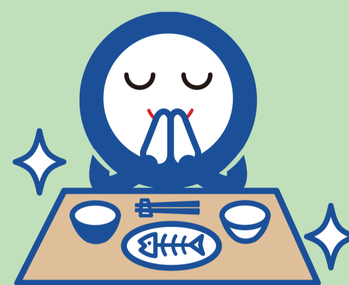
千葉市ごみ削減キャラクター へらそうくん

3010運動は、宴会時の食品食べ残しを減らすための取り組みです。 忘年会・新年会は楽しく食べきろう！