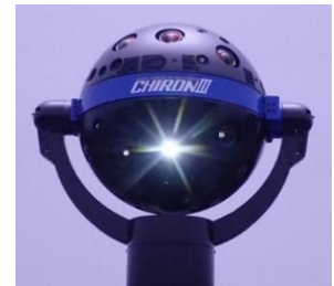
新投影機「ケイロンⅢ」