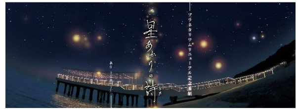
星あかりの詩イメージ