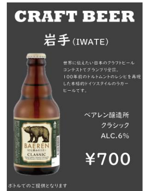
販売予定のクラフトビール銘柄（一部）