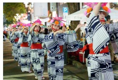
現在着用している浴衣

現行のデザインについては、昭和52（1977）年に親子三代千葉おどりが完成し、浴衣を統一して踊ることを目的に作成されました。千葉の親子三代夏祭りに参加しているおどりの団体等が着用しています。