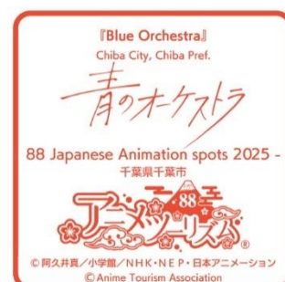
ご朱印スタンプイメージ