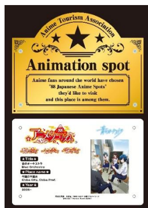
アニメ聖地88認定プレートイメージ