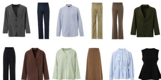
カジビジアイテムイメージ