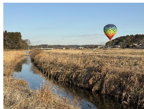
昨年の気球体験イベントの様子