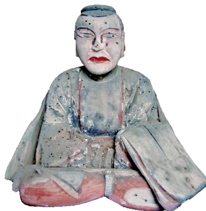
千葉胤富木像(西音寺蔵)