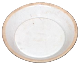
白磁皿(思井堀ノ内遺跡出土) (千葉県教育委員会蔵)