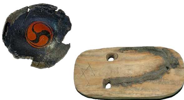
漆碗・下駄(大崎城跡出土) (香取市教育委員会蔵)