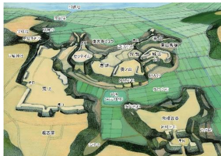
本佐倉城跡鳥瞰図