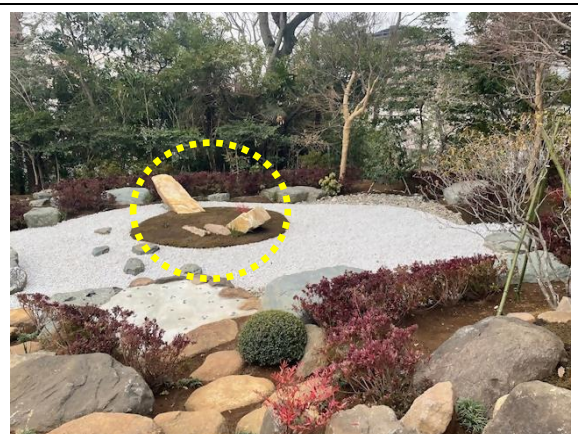
月星紋をモチーフとした石組