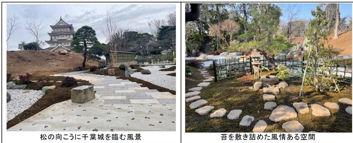
松の向こうに千葉城を臨む風景