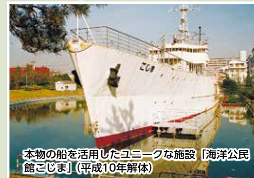
本物の船を活用したユニークな施設「海洋公民館こじま」(平成10年解体)