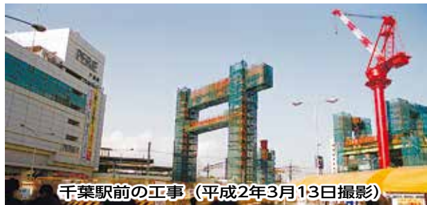
千葉駅前工事 (平成2年3月13日撮影)

モノレール千葉駅から県庁前駅間が開通し、懸垂型としては営業距離世界最長の15.2キロメートルを誇るモノレールが整備されました。