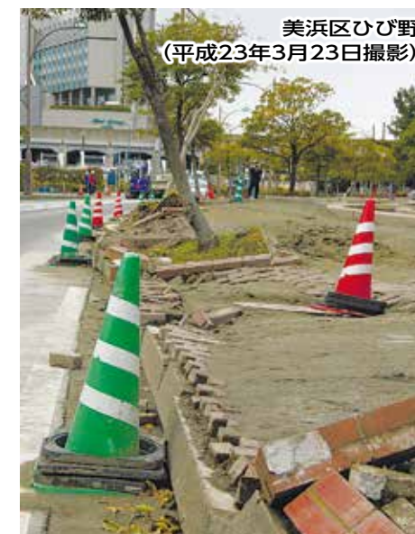
美浜区ひび野 (平成23年3月23日撮影)