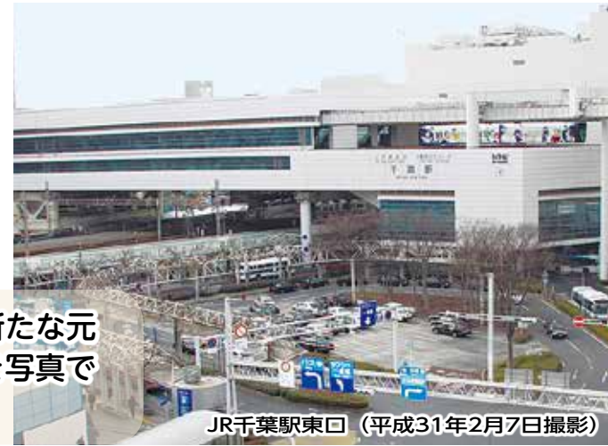
JR千葉駅東口 (平成31年2月7日撮影)

平成という時代が幕を閉じ、5月から新たな元号に変わります。千葉市の平成30年を写真で振り返ります。