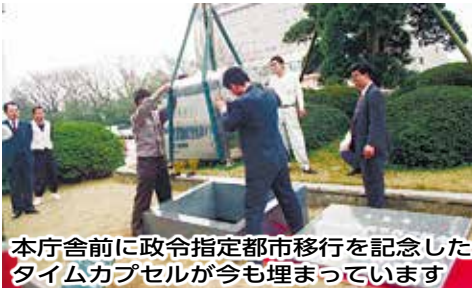
本庁舎前に政令指定都市移行を記念したタイムカプセルが今も埋まっています

全国12番目の政令指定都市・千葉市が誕生し、大都市として新たな歩みを始めました。