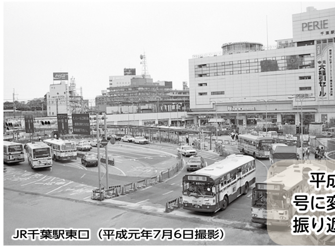
JR千葉駅東口 (平成元年7月6日撮影)