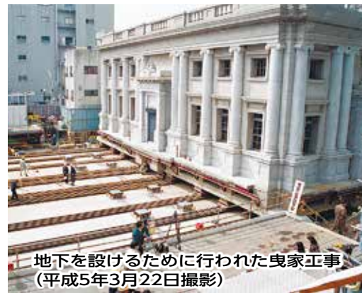
地下を設けるために行われた曳家工事 (平成5年3月22日撮影)

昭和2年に建てられた旧川崎銀行千葉支店の建物が、新しいビルの内部に包みこまれるようにしてそのまま復元保存されました。中央区役所は今年5月に、さぼーる (平成19年10月オープン) へ移転し、市美術館は2020年7月にリニューアルオープンする予定です。