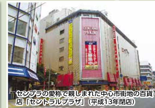
セシプラの愛称で親しまれた中心市街地の百貨店「センドラルプラザ」(平成13年閉店)