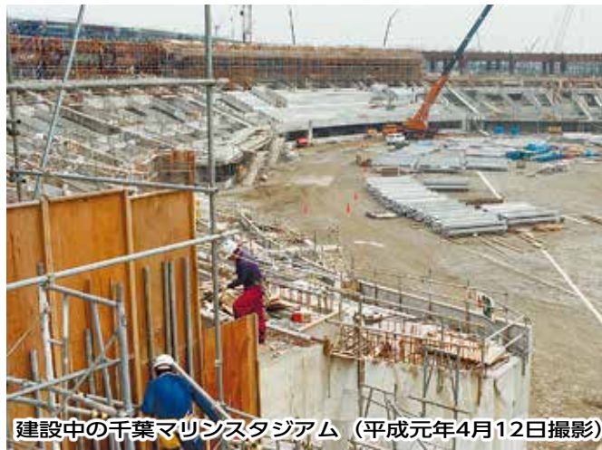
建設中の千葉マリンスタジアム (平成元年4月12日撮影)