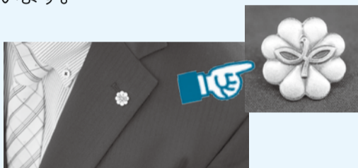
活動の際は、バッジを携行しています

少子高齢化の進行などにより、地域のつながりが薄れる中で、福祉に関する地域の身近な相談相手として活躍しています。地域を見守り、困っている人に福祉サービスなどの情報を伝え、市などの関係機関へつなぐ民生委員・児童委員は、地域福祉の要として重要な役割を担っています。