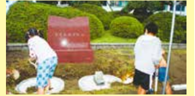
20年前に市役所前に埋設

指定ごみ袋や住民票などの証明書の台紙（コンビニ交付を除く）に、市制100周年記念ロゴマークが入ります。