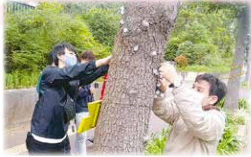
大学生によるイルミネーション設置