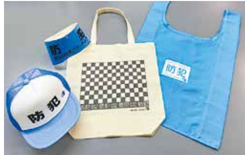
左から帽子、腕章、エコバック (どちらかひとつ)