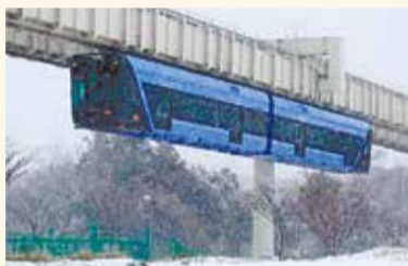
雪にも強い千葉モノレール

レールにぶら下がる懸垂型の中でも、車輪がボックスの中に納まり、安全性の高いサフェージュ式と呼ばれる構造です。